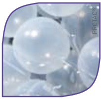
Boles de plàstic

De boles de plàstic EVA (38 o 50 mm), de perles de poliestirè, o de la combinació d'ambdues.