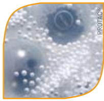
Combinació boles i perles

El farcit a base de boles de plàstic exerceix més pes i pressió, proporcionant una forta estimulació sensorial.